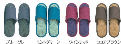
ブルーグレー ミントグリーン ワインレッド ココアブラウン